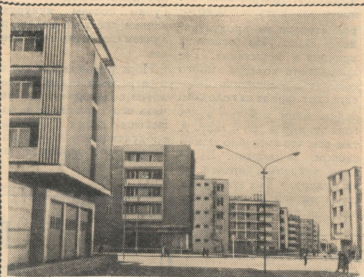
Около 23 процентов населения Румынской Народной Республики получили новые квартиры за последние 13 лет. В текущем году предусмотрено построить еще 54 тысячи квартир. НА СНИМКЕ: новые дома в центре города Бая-Маре.