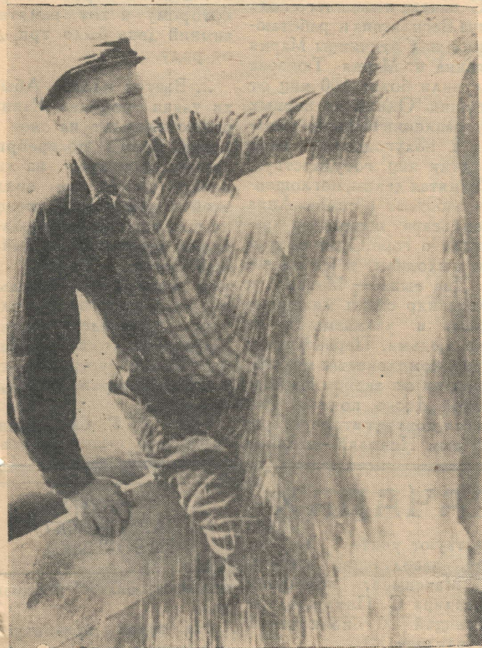
Под яркими солнечными лучами летят золотые брызги. Огромной радостью наполняют они сердце хлебороба (снимок слева).

№ 100 (385) | ПЯТНИЦА, 21 августа 1964 г | Цена 2 коп.