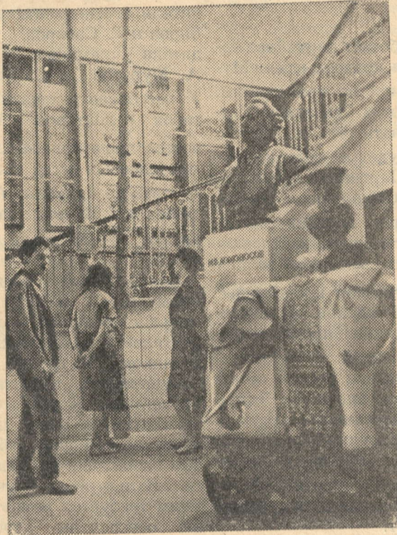
НА СНИМКЕ: у входа в музей антропологии и этнографии Академии наук СССР.