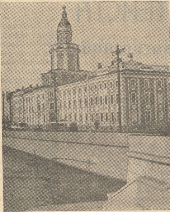
НА СНИМКЕ: здание Кунсткамеры на Университетской набережной Невы.

В ней хранились анатомические, зоологические и исторические коллекции, собранные во многих районах России по правительственным указам, коллекции, приобретенные Петром I в Голландии, и его личные собрания оружия и произведений искусства. К началу XIX века в Кунсткамере скопилось громадное количество коллекций, требовавших специального изучения. В связи с этим были созданы Анатомический, Ботанический, Зоологический и другие музеи, существующие и в настоящее время. В здании Кунсткамеры теперь помещается Музей антропологии и этнографии имени Петра Великого.