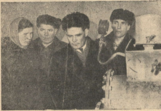
Члены делегации в кормоцехе.