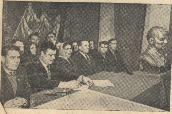
Президиуме вечера — передовые люди двух соревнующихся колхозов. С ними же — Габдулла Тукай.

Клубная Заводовке. Зал полон народу. В глубине сцены — большой портрет великого поэта Габдуллы Тукай. За столом — покрытым кушачом — люди двух колхозов. Председатель колхоза Григорий Шорин говорит: «Мы привезли его в подарок вам, дорогие друзья. Имя этого великого