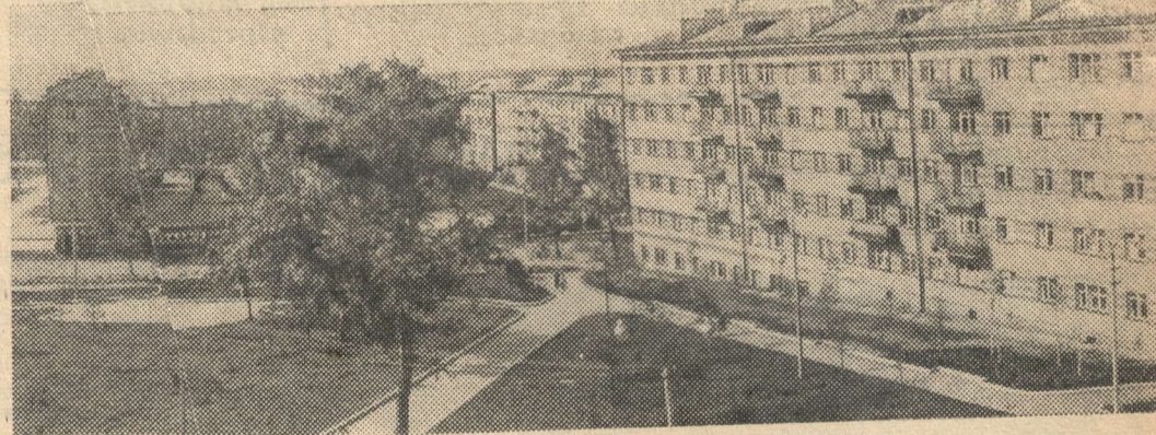
30 лет назад (28 декабря 1934 года) Удмуртская автономная область была преобразована в АССР. На снимке:жевск — столица Удмуртской АССР. Новый жилой массив на улице Труда. Фотохроника ТАСС

На Челябинском металлургическом заводе закончили испытание нового автоматизированного блюминга „1300“. Все установки действуют нормально. Новый стан сконструирован и изготовлен на Уралмашзаводе в Свердловске. В производстве оборудования блюминга участвовали предприятия всех экономических районов страны. (ТАСС)