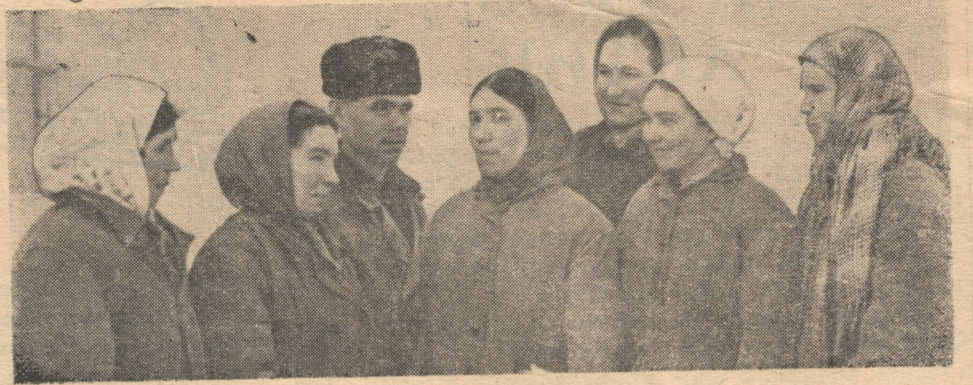
Хороших показателей по получению приплода и сохранению поголовья добились работники Гайтанкинской овцефермы № 1 колхоза „Путь к коммунизму“.