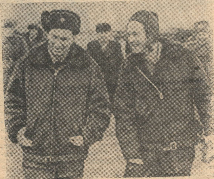
Космонавты Павел Иванович Беляев и Алексей Архипович Леонов после приземления.

Июньский Пленум ЦК КПСС 1963 года отметил, что в усилении идеологической работы среди населения огромную роль призваны сыграть сельские очаги культуры. Они должны стать подлинным центром массово-политической работы на селе.