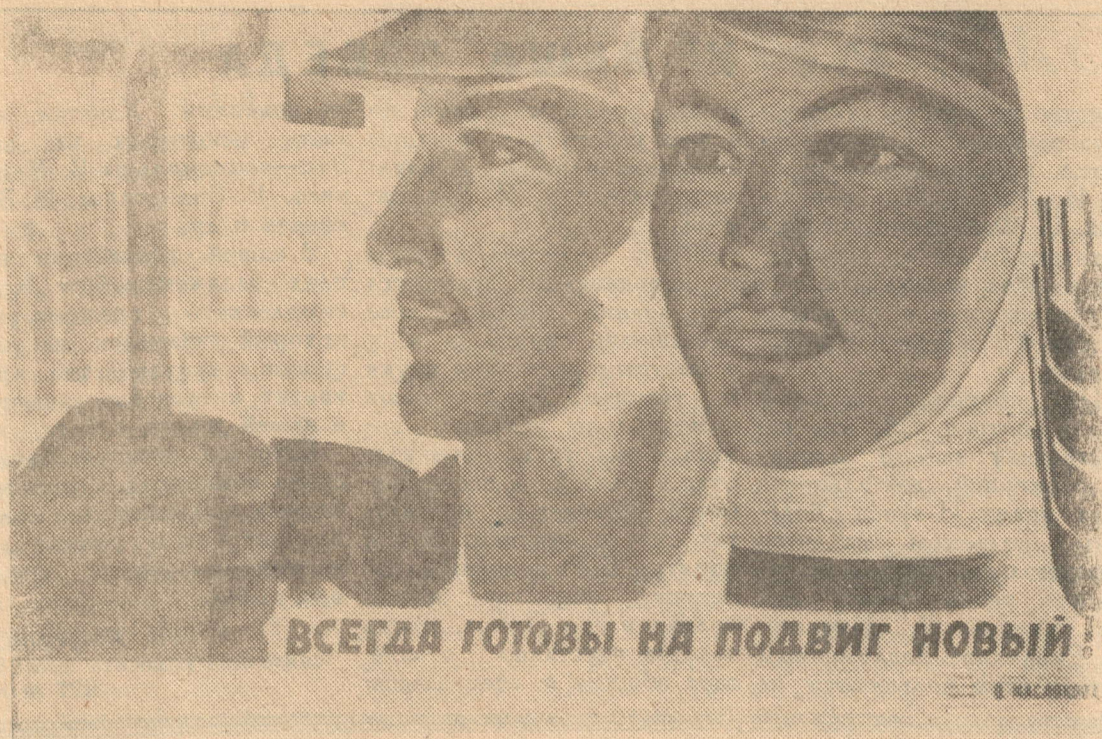
Плакат художника О. Маслякова. Издательство «Советский художник».

№ 128 (3257) ПЯТНИЦА, 29 октября 1965 . Цена 2 коп