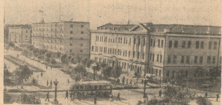
Йошкар-Ола. На проспекте Чавайна.