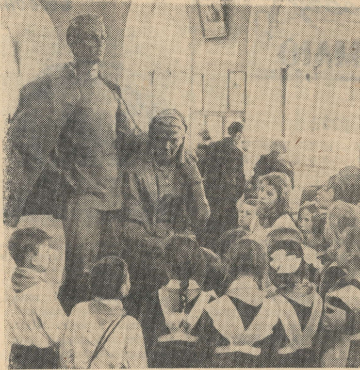
МОСКВА. Накануне 97-й юбилея со дня рождения Владимира Ильича Ленин особенно оживленно.

Здесь в многочисленных залах собраны исторические документы, личные вещи Владимира Ильича, картины и скульптуры, ярко рассказывающие о жизни и революционном пути великого вождя пролетарской революции В. И. Ленина. Среди посетителей музея всегда можно увидеть школьников и людей старшего поколения, приехавших на экскурсию в столицу из многих областей и республик нашей Родины. Частыми посетителями музея являются иностранные туристы и делегации из разных стран мира.