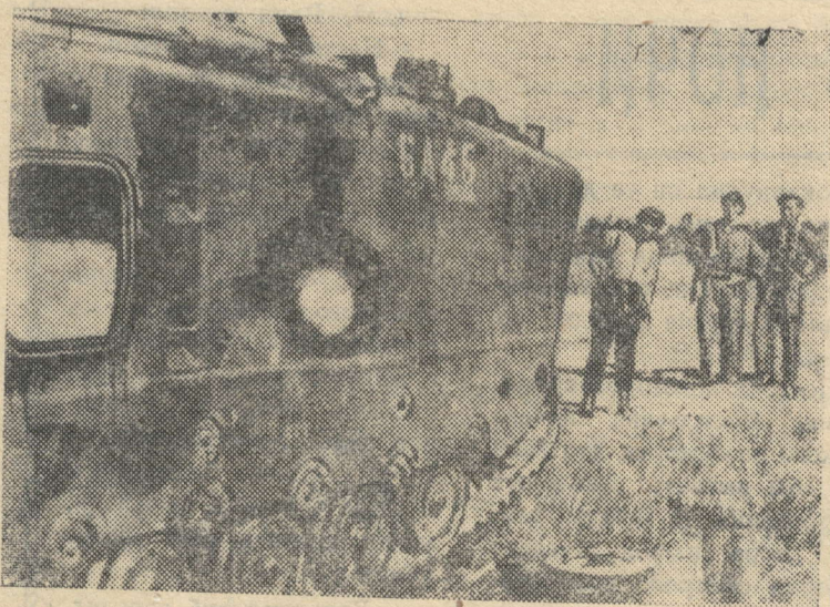
Южный Вьетнам. Этот американский бронетранспортер был подбит бойцами Армии освобождения в районе демилитаризованной зоны.