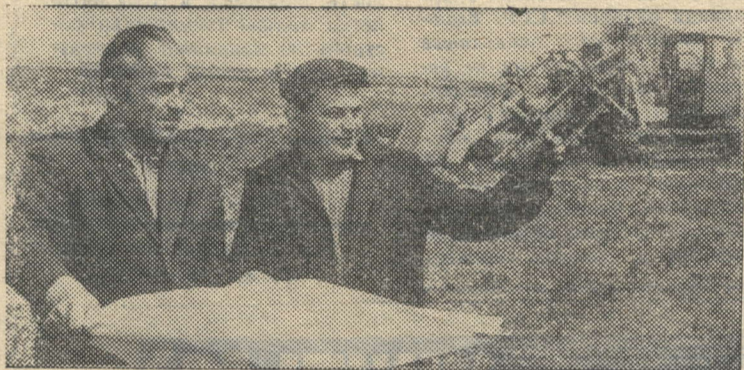
Закарпатская область. 850 гектаров переувлажненных земель в колхозе имени XXII партсъезда Мукачевского района, осушены, хозяйство планирует в будущем подготовить для землепользования еще 400 гектаров.