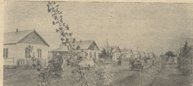
Колхоз „Красный Октябрь“ Илэского района — один из лучших в Оренбуржье — уже в начале июня перевыполнил полугодовые планы продажи государству мяса, яиц, молока, шерсти. За достигнутые успехи колхоз „Красный Октябрь“ награжден орденом Ленина. На снимке: одна из новых колхозных улиц — Октябрьская.

третье место в стране, уступая лишь таким крупным рес-