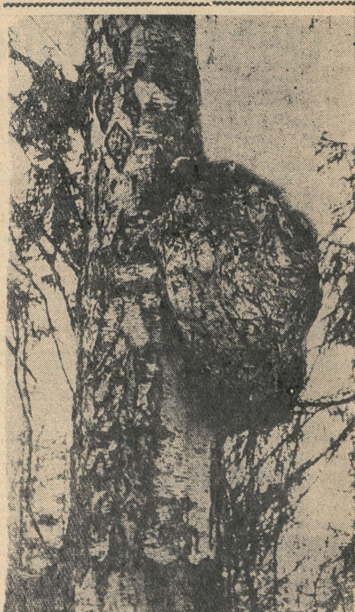
Природа ранила березу.