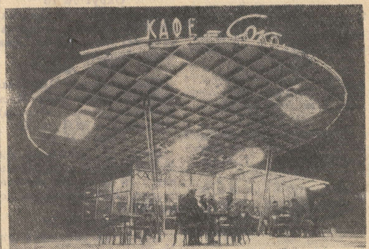
В Москве открыта выставка «ТАСС фото-66». Здесь экспонируется около 500 снимков, сделанных фотокорреспондентами ТАСС и телеграфных агентств союзных республик. На стендах — фотоинформация о важнейших событиях в жизни страны и за рубежом, фотоочерки, хроникальные, жанровые и спортивные снимки.

Писем о хороших людях, о теплоте и заботе, о взаимном уважении друг к другу в редакцию поступает немало. О них можно сказать, что это настоящие советские люди.