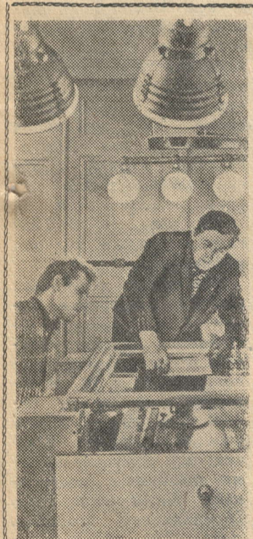
ОРСК. На Южуралмашзаводе ведется большая работа, направленная на облегчение труда инженерно-технического персонала. Машинки внедряются повсюду: в отделах главного конструктора, главного технолога. Получена комплексная группа машин для быстрого размножения технической документации, работают множительные аппараты "Эра". В бюро технических расчетов отдела главного конструктора имеется электронная настольная клавишная вычислительная машина "Вега". Применение механизмов высвобождает рабочее время инженеров для творческих занятий.

В этом году они приняли обязательство вырастить и собрать с каждого гектара не менее 13,5 центнера зерновых, 175 центнеров сахарной свеклы и 250 центнеров зеленой массы кукурузы с гектара. Резкое увеличение производства продукции земледелия будет лучшим подарком наших колхозников знаменательному празднику — 50-летию Советского государства. А. ВЛАСОВ, агроном колхоза "Первое мая".