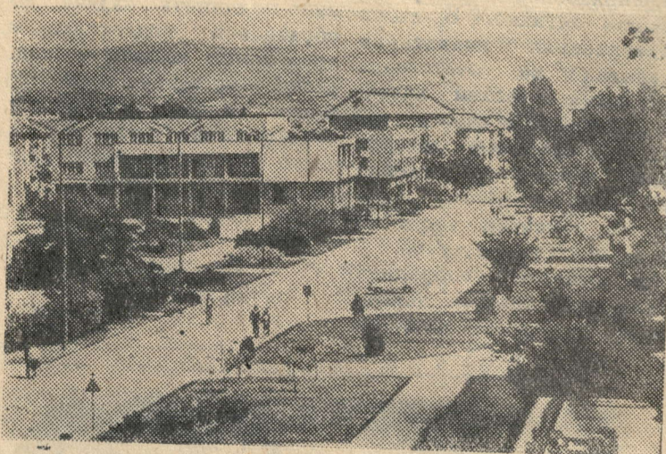
Югославия. Новый Травник — один из самых благоустроенных промышленных центров Боснии и Герцеговины. Этот новый „город молодости“ вырос за последнее десятилетие на месте, где веками шумел глухой сосновый бор. Средний возраст его жителей — 30 лет.