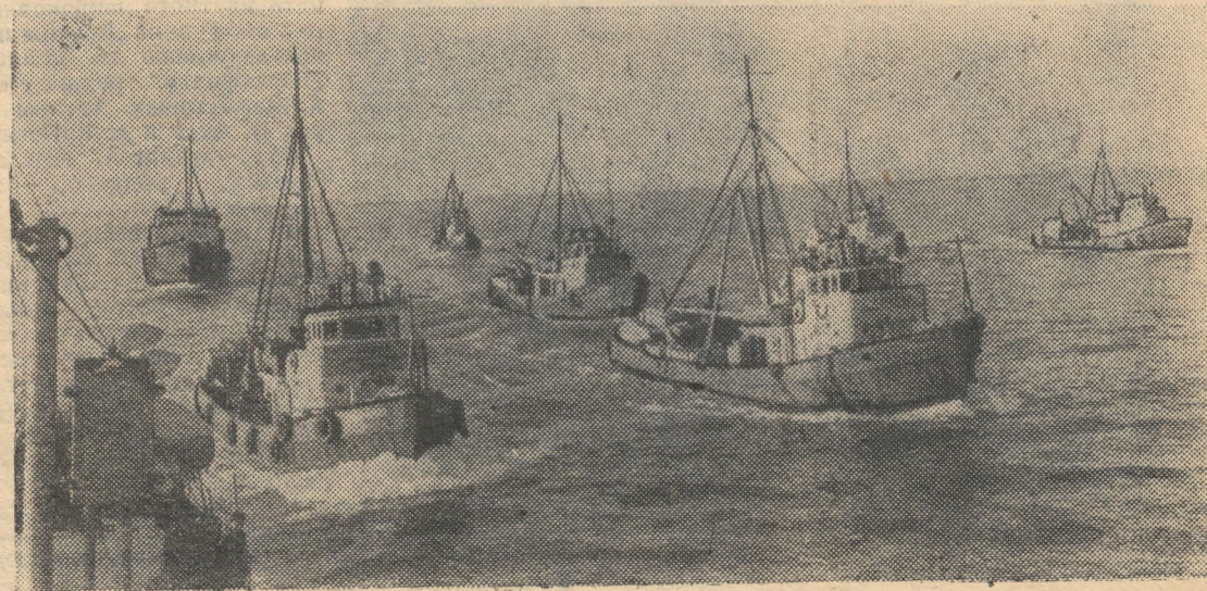
Сейнеры выходят на промысел в Каспийском море.

Советские рыбаки с нарастающей энергией разворачивают борьбу за осуществление задач, поставленных партией и правительством, за досрочное выполнение плана второго года пятилетки. Свой праздник они встречают новыми трудовыми успехами.