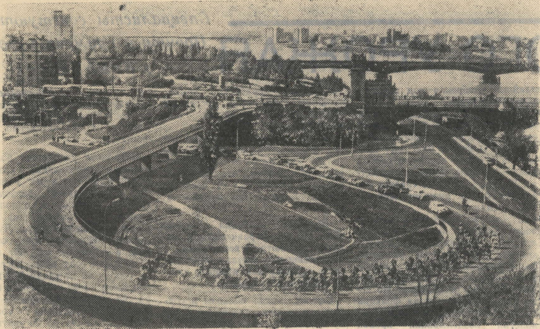
Польская Народная Республика. Варшава сегодня. Въезд на мост Понятовского.