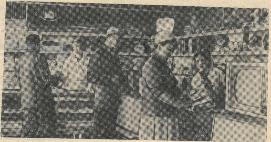
В магазине деревни Карамышево (Тульская область) можно приобрести все необходимое.