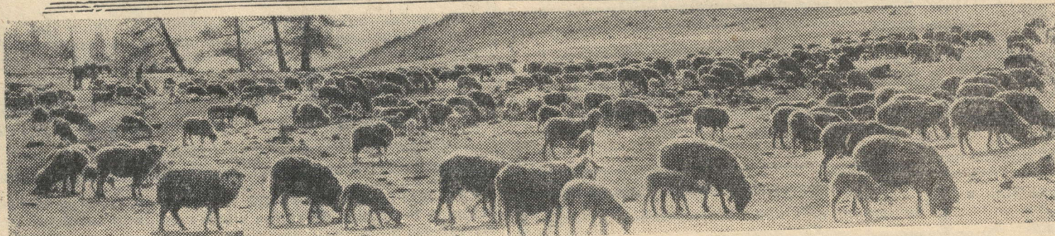
В колхозах и совхозах созданы крупные животноводческие фермы. На снимке: отара овец пятой фермы колхоза имени Карла Маркса на высокогорном пастбище (Алтайский край).