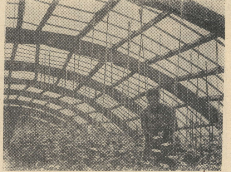
КУЙБЫШЕВСКАЯ ОБЛАСТЬ. Совхоз «Волгарь» круглый год снабжает овощами промышленные центры Поволжья. Теплицы здесь одеты в полиэтиленовую пленку, которая отлично пропускает солнечный свет, сохраняет тепло и высокую влажность воздуха.

Советский Союз по производству минеральных удобрений занимает сейчас первое место в Европе и второе в мире (после США). За последние годы поставки удобрений сельскому хозяйству возросли почти в два раза. В этом году село получит их до