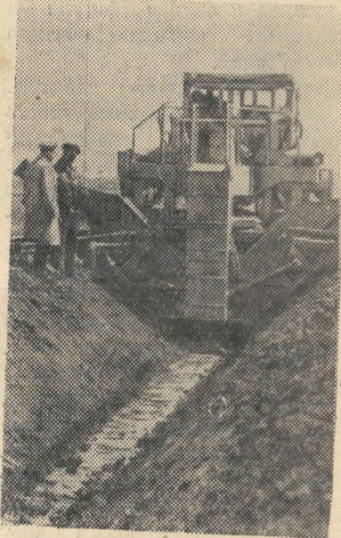
ХЕРСОНСКАЯ ОБЛАСТЬ. Мощными землеройными механизмами вооружены строители оросительных систем на юге Украины. На снимке: ЭТР-122 прокладывает канал в совхозе «Заря коммунизма» Скадовского района.

увеличить в 1,5 раза. Это означает, что в 1970 году Украинская ССР произведет промышленной продукции намного больше, чем ее давала вся промышленность Советского Союза в 1940 году. До 37—38 миллионов тонн намечено довести валовый сбор зерна. ...Величаво катит свои волны помолодевший Днепр-Славутич. А по обоим берегам его слышатся слова гимна республики. «Живи Украина — прекрасна и сильна...» В. КОЛОМИЕЦ. (Корр. ТАСС).