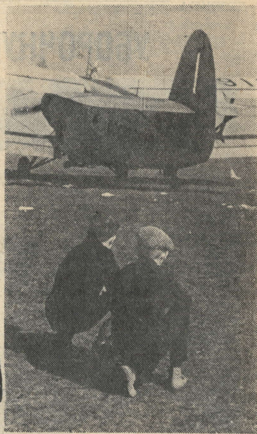
„Хотя бы на таком...“