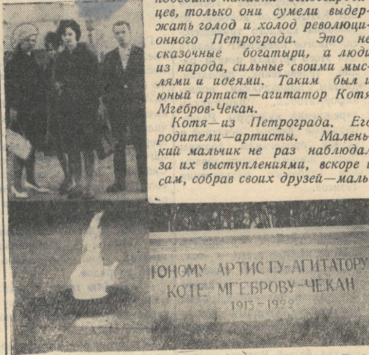
НА СНИМКЕ: Ленинград, Марсово поле... Люди, люди... Сколько раз приходят они сюда, почтить память погибших героев.

Если хотите узнать больше о К. Мгеброве-Чекане, прочтите сборник „Всегда готов!“, посвященный ленинградским пионерам.