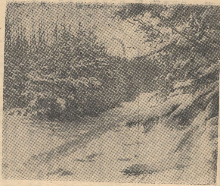
Мороз снежком укутывал...