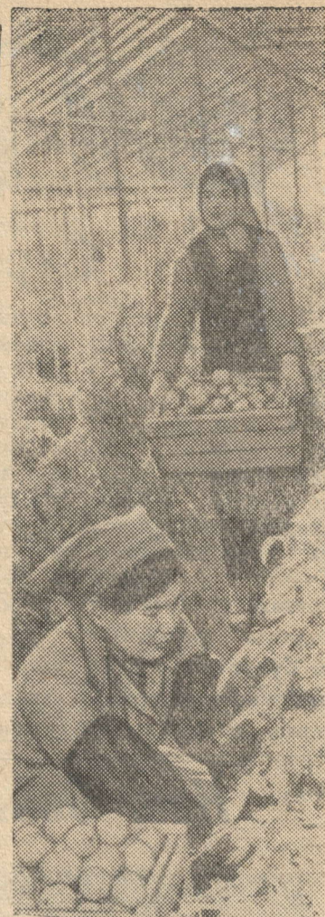
ТАШКЕНТСКАЯ ОБЛАСТЬ. Круглый год отправляет в торговую сеть свежие овощи колхоз имени Карла Маркса «Калининского района». Сейчас в тепличном комбинате зреют помидоры, лук и петрушка. Ежедневно овощеводы снимают сотни килограммов зелени и томатов.