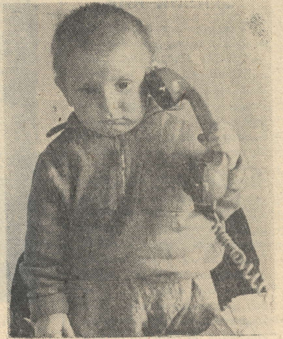
Позвоню-ка я папе.

Дети многих стран нашей планеты не защищены и от других бедствий: нищеты, голода, болезней, расовой дискриминации, эксплуатации их труда. В 1959 году Генеральная Ассамблея ООН приняла Декларацию о правах детей. Но права эти в капиталистических странах остаются на бумаге. И в день 1 июня все честные люди земли еще раз скажут свое веское слово в защиту счастья детей.