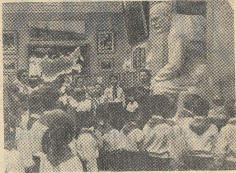
Народ разговаривает с Лениным. К вождю «приходит и стар, и млад. Вот юные ленинцы прибыли в Центральный музей В. И. Ленина в Москве.

Журналистов на встрече интересовали вопросы мастерства. У нас, например, хорошо получаются критические статьи, а положительных, интересных — маловато. Отчего так происходит? Возьмем хотя бы присылаемые в редакцию заметки о хороших людях — передовиках производства, ударниках коммунистического труда. У корреспондента вошло в привычку сказать о своем односельчанине пару хвалебных слов и назвать цифры. Почему-то все хорошие люди очень скромные, даже застенчивые, обязательно голубоглазые, никогда не знают усталости, работают с раннего утра до позднего вечера. А если будет чуть по другому, смотришь, и герой-то плохой, и заметка негодной получилась.