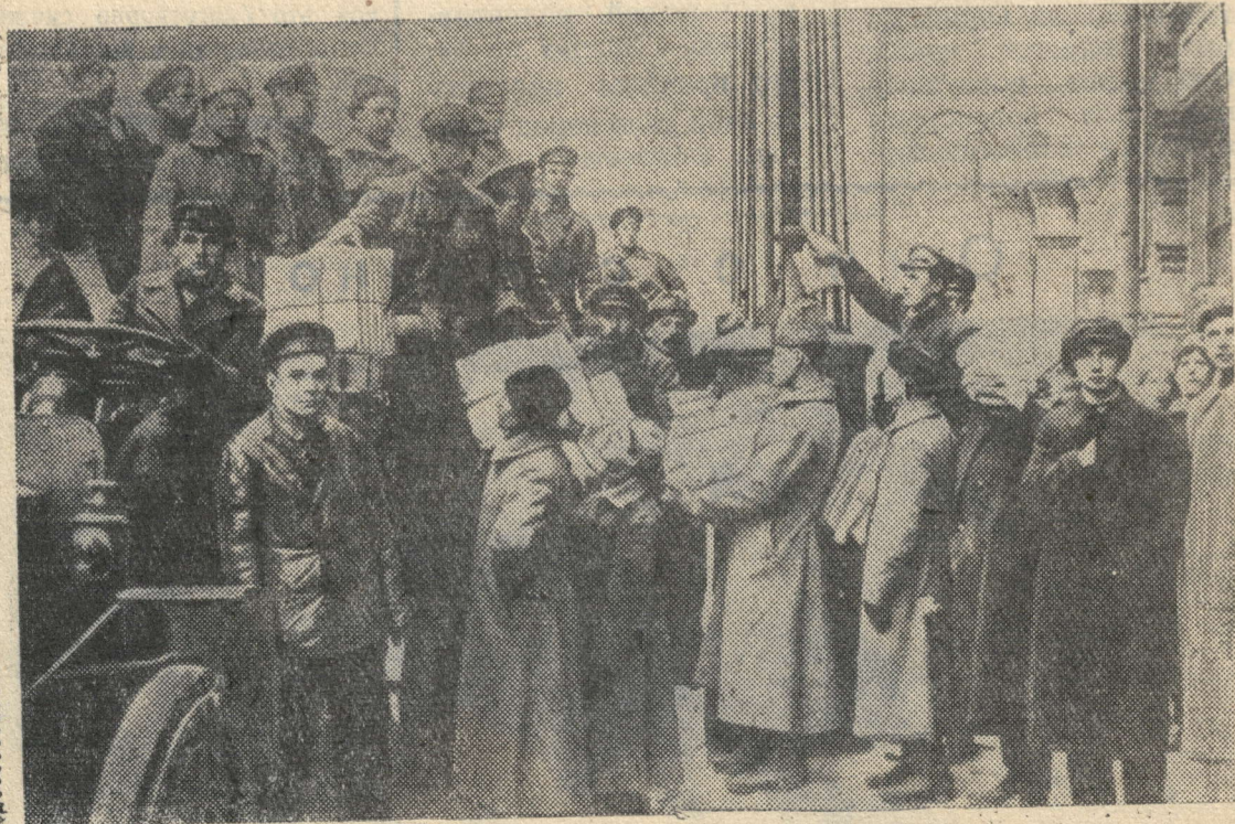
Раздача газет в первый день заседания документов СССР. Советов в Москве.