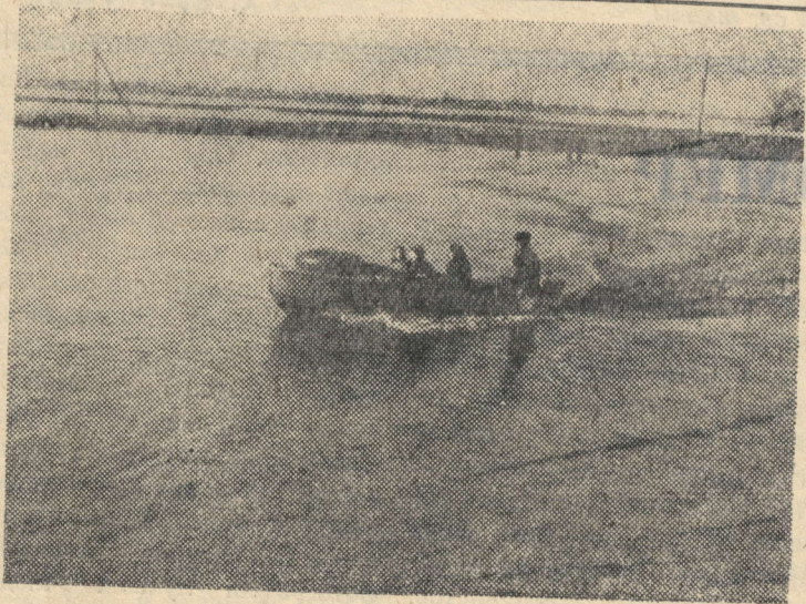
На моторке на работу.