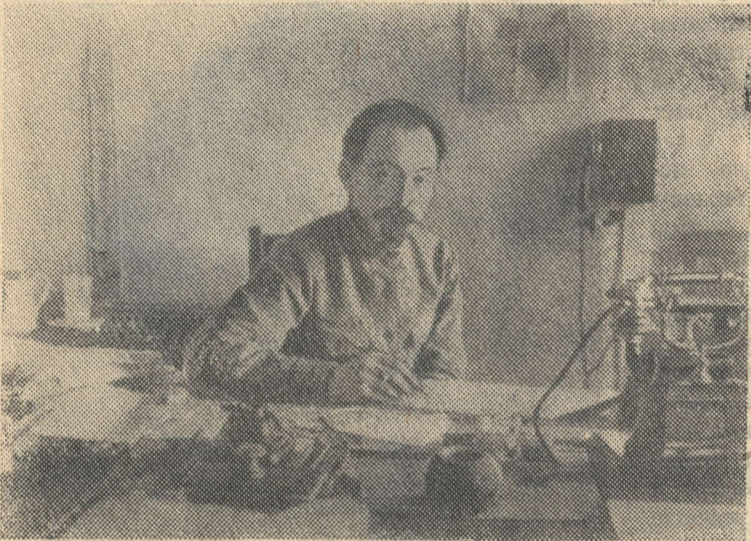
Ф. Э. Дзержинский.