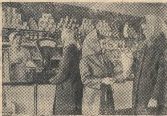
Расширяется сеть магазинов в селах. Построен новый магазин и в деревне Пушкари Ефремовского района Тульской области.