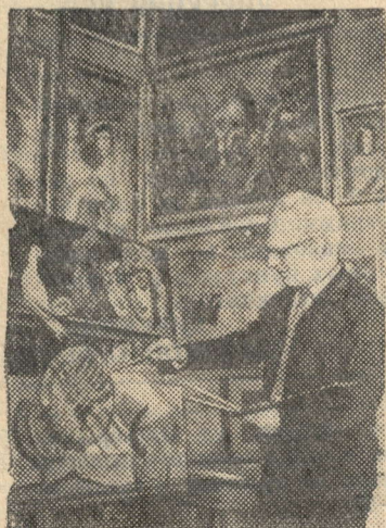
Народный художник Грузинской ССР, лауреат премии имени Ш. Руставели Ладо Гудиашвили за работой, Руставский азотнотуковый завод.