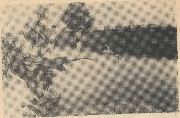
Уготовано самой природой.

Прожила Прасковья Федоровна почти всю жизнь в городе. Но деревенское, бабуе, так и рвалось наружу в каждом ее движении. А как ей хотелось быть похожей на тех, кто заходил к ней в ГУМ в норковых шубках и, не замечая никого и ничего, говорили: «Что новенького?»