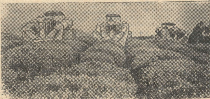
Аджарская АССР. Машины «Сакарт-вело» на сборе зеленого листа на чайных плантациях Очхамурского совхоза (на снимке вверху справа).