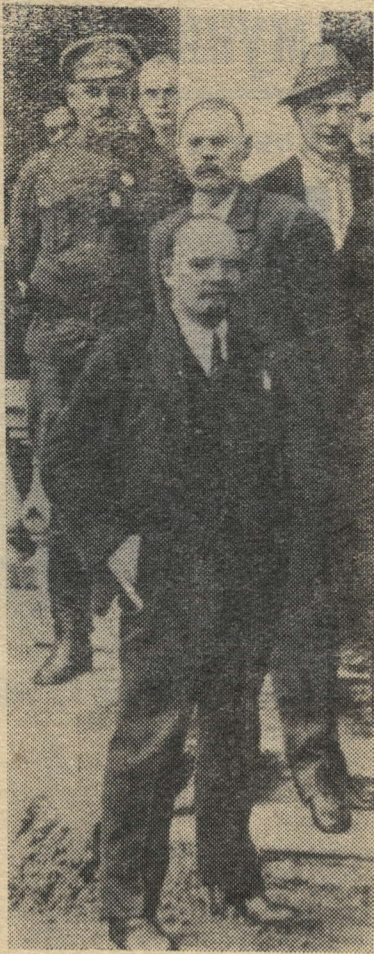
В. И. Ленин, А. М. Горький в группе делегатов II конгресса Коминтерна у дворца Урицкого (Таврический дворец).

1920 год, 19 июля. Петроград.