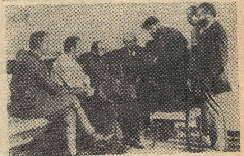
В. И. Ленин в Кремле беседует с итальянскими делегатами II конгресса Ко-

миттерна. Москва, июль-август 1920 года.