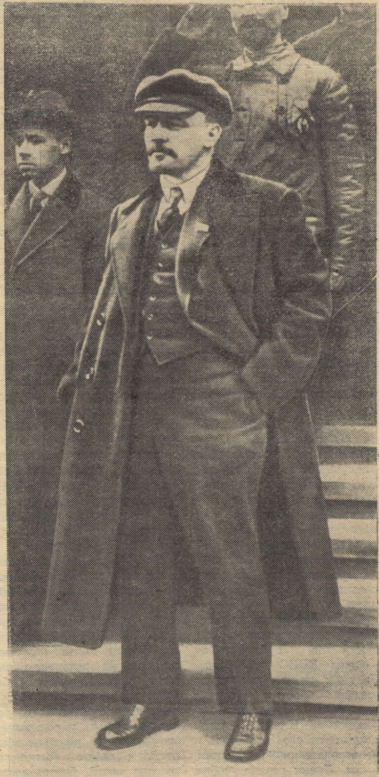
В. И. Ленин на Красной рации 1 Мая 1919 года.

Наша уверенность в том, что все эти трудные задачи будут успешно решены, — не только результат теоретического анализа. Она базируется на неопровержимых фактах истории XX века, в течение которого более трети человечества освободилось от ига капитала. Она базируется на опыте истинно грандиозных перемен, которые произошли и происходят в странах социализма. Она базируется на нашем собственном опыте — опыте страны, которая впервые в мире практически приступила к строительству коммунизма. Выполняя намеченную партией Программу, советские люди своим неустанным трудом, своими героическими усилиями прокладывают путь, по которому рано или поздно пойдут трудящиеся всех стран. И каждый наш успех, каждая победа наша приближает тот час, когда все человечество разорвет социальные и нравственные путы прошлого. (Окончание. Нач. на 2 стр.)