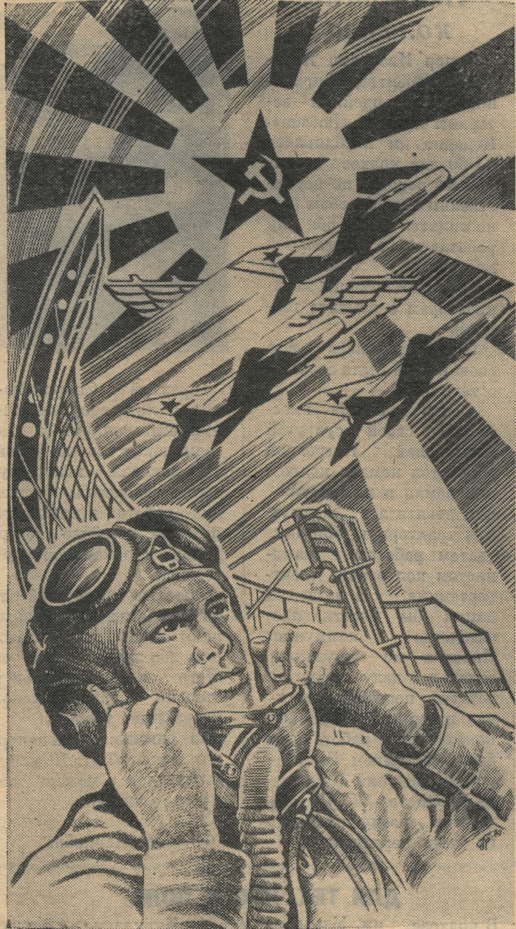
НА СТРАЖЕ МИРНОГО НЕБА.