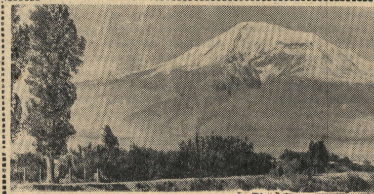
Армянская ССР. В Араратской долине.