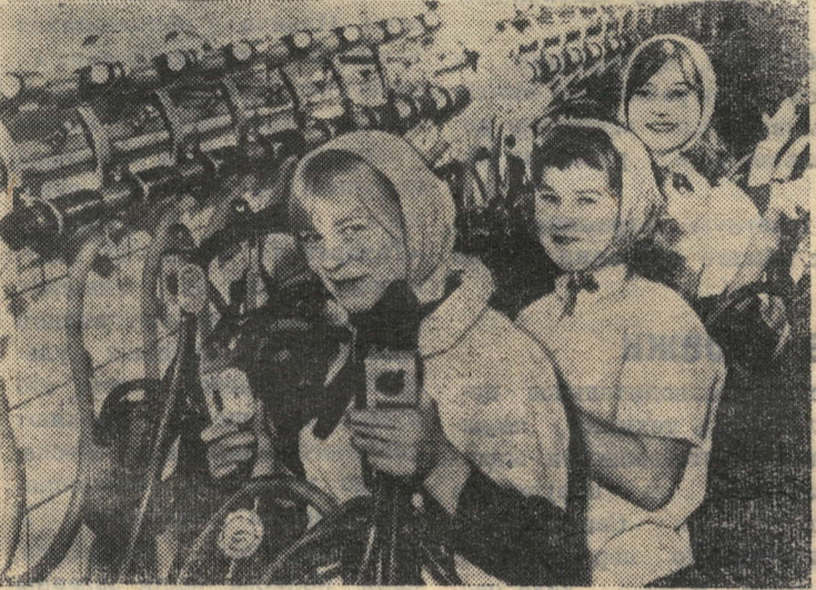
Молодые животноводы народного имени в Эберсбахе-Штокхаузене (ГДР). От каждой из обслуживаемых молодежной бригадой по 5.200 килограммов молока за год получено лока.