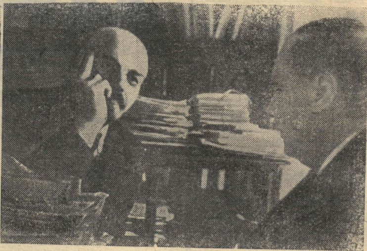
На снимках (слева направо): В. И. Ленин выступает на площади Свердлова перед войсками, отступающими на фронт. Москва, 5 мая 1920 года. В. И. Ленин в своем кабинете в Кремле беседует с английским писателем Гербертом Уэллсом. Москва, октябрь 1920 года. Фотохроника ТАСС.