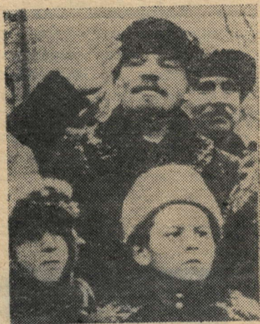
В. И. Ленин на Красной площади во время празднования 2-й годовщины Великой Октябрьской социалистической революции. Москва, 7 ноября 1919 года.