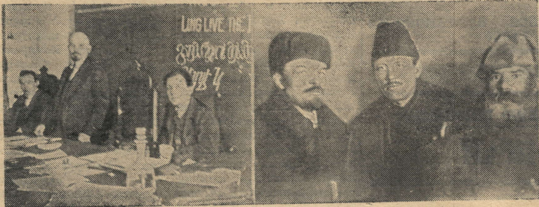
В. И. Ленин в президиуме I конгресса Коминтерна в Кремле. Слева направо: Г. Эберлейн, В. И. Ленин и Ф. Платтен. Москва, 2—6 марта 1919 года.