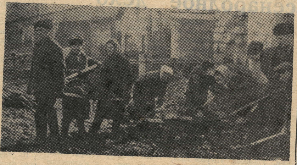
НА СНИМКЕ: рабочие и служащие приводят в порядок территорию завода.

Коллектив ремонтно-механического завода активно участвовал во Всесоюзном коммунистическом субботнике, и принял решение проводить такие субботники в году великих юбилеев почаще. Вот и в минувшее воскресенье одна группа рабочих и служащих завода была занята на сооружении трибуны для городского стадиона, а вторая группа убирала территорию.