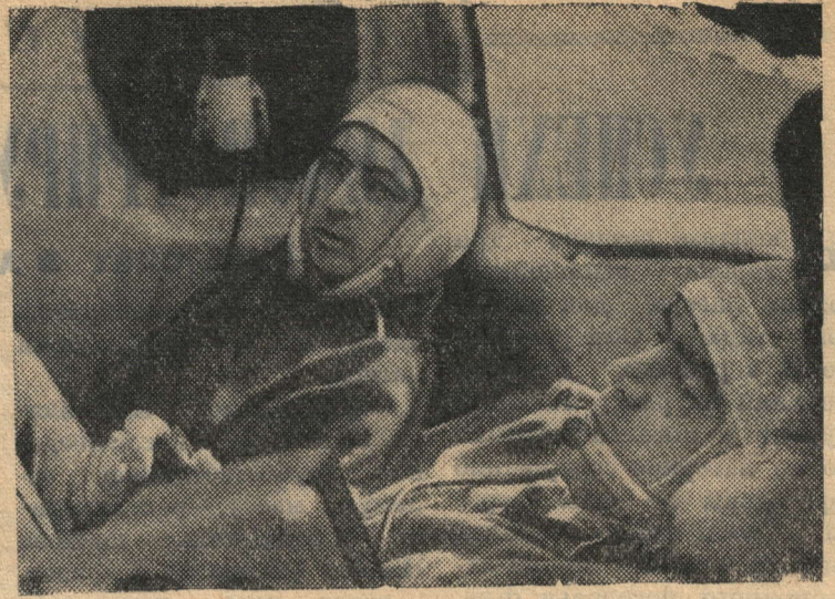
Командир космического корабля «Союз-9» А. Г. Николаев (на переднем плане) и бортинженер В. И. Севастьянов на тренировках.