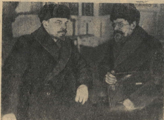
На снимке: В. И. Ленин и М. И. Калинин в Доме Союзов во время работы I Всероссийского съезда трудовых казаков. Москва, 1 марта 1920 года.