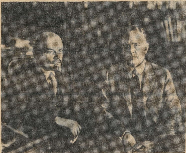
В. И. Ленин в своем кабинете в Кремле беседует с американским экономистом П. Христенсеном. 28 ноября 1921 года.