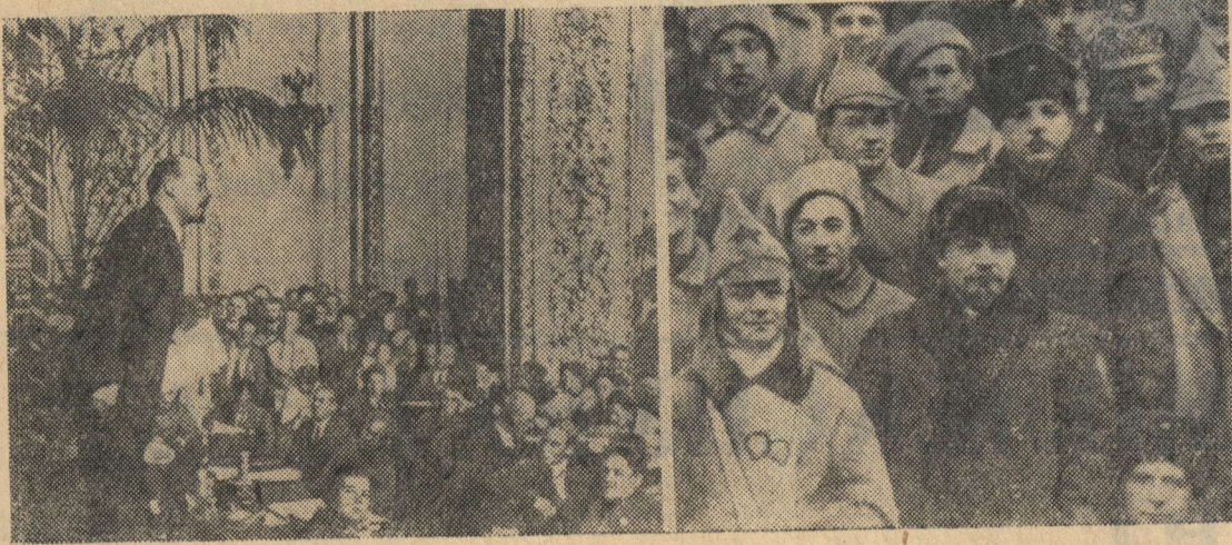
На снимках (слева направо): В. И. Ленин произносит речь на заседании III конгресса Коминтерна в Андреевском зале Кремля. Москва, июнь-июль 1921 года; В. И. Ленин и К. Е. Ворошилов в группе делегатов X съезда РКП (б)—участников подавления Кронштадтского мятежа. Москва, март 1921 года.