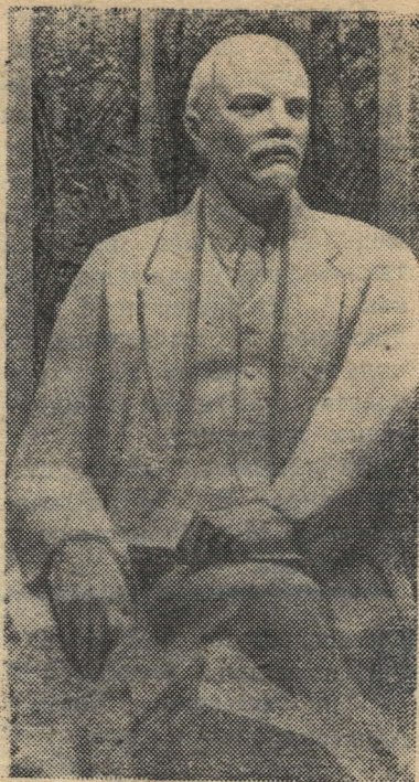
Ульяновск. Ленинский мемориальный центр.

Кабинет политического просвещения райкома КПСС.