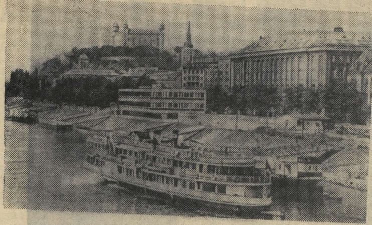
На снимке: набережная Дуная в Братиславе.