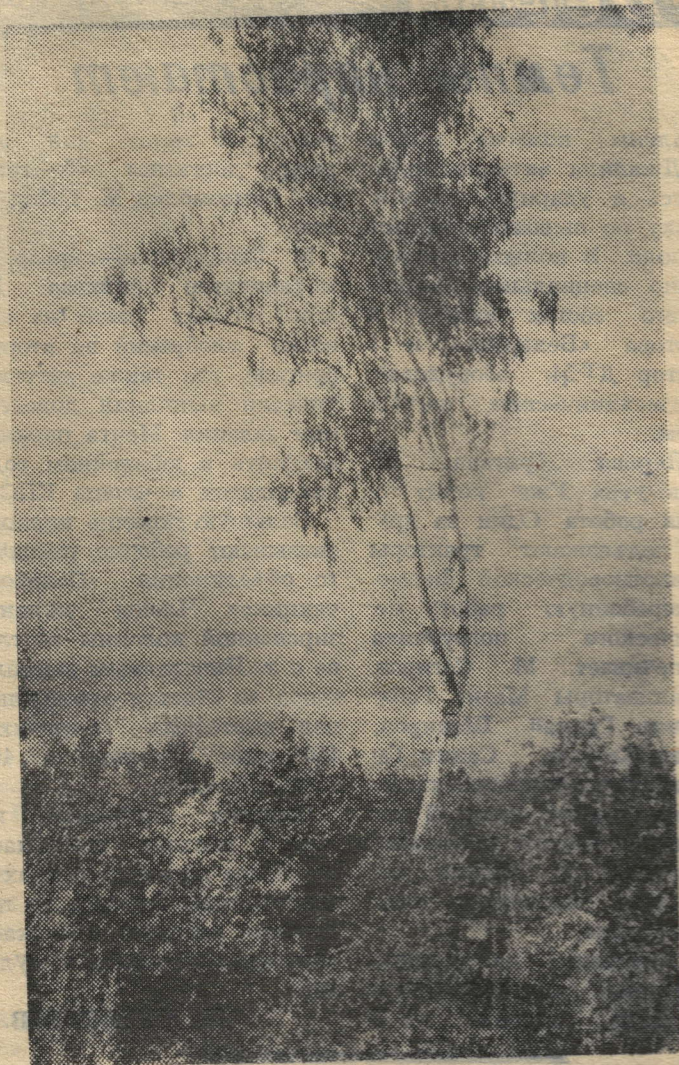
„БЕРЕЗКА“ в саду Фотоэтиюд Семена Синянова.