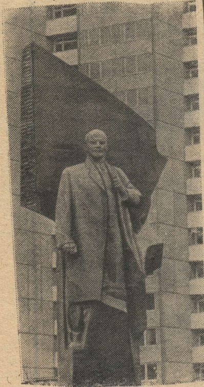
БЕРЛИН. Памятник Владимиру Ильичу Ленину был открыт недавно в столице ГДР. Он сооружен по проекту советского скульптора народного художника СССР Н. В. Томского.