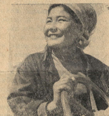
Гурьевская область. По призыву комсомола многие выпускники средних школ

—Колхозный ансамбль, состоящий из комсомольцев и молодежи, на республиканском смотре самодеятельных коллективов в 1964 году был награжден ценным подарком—музыкальными инструментами. К этим инструментам и по сей день не прикасалась рука человека. Для руковод-