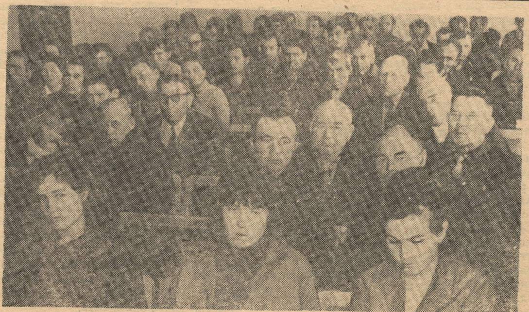
Семинар пропагандистов в зале заседаний райкома КПСС.