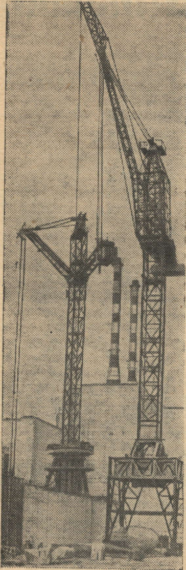
Свердловская область. В завершающем году пятилетки коллектив Белоярской атомной электростанции.

кой атомной электростанции имени И. В. Курчатова трудится с особым подъемом. Он вышел победителем в социалистическом соревновании энергетических предприятий страны и по результатам работы за второй квартал ему вручено переходящее Красное знамя Министерства энергетики и электрификации СССР и ЦК профсоюза рабочих электростанций и электропромышленности. Энергетики АЭС добились высоких эксплуатационных показателей.