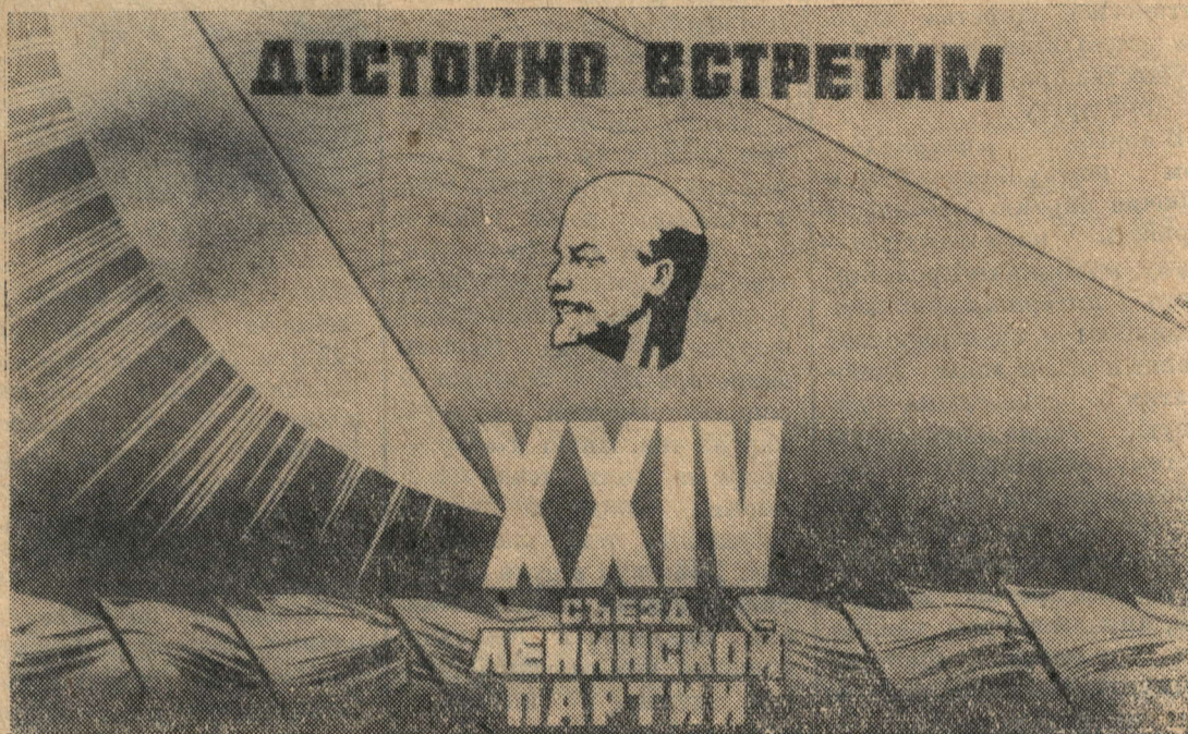
Плакат художника В. Викторова (издательство „Изобразительное искусство“).