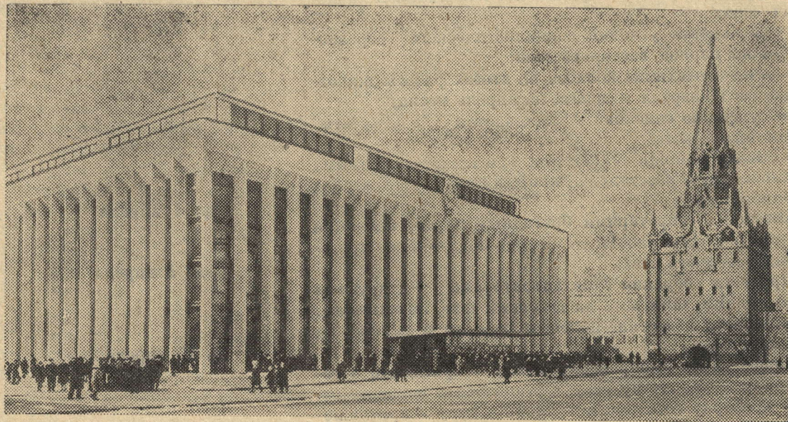
МОСКВА. Кремлевский Дворец съездов. 30 марта в этом здании начал свою работу XXIV съезд КПСС.

Для участия в работе съезда прибыла 101 делегация от коммунистических, рабочих, национально-демократических и левых социалистических партий из 90 стран мира.