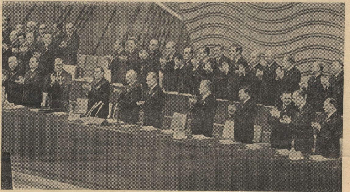
Москва. XXIV съезд КПСС. На снимке: в президиуме съезда.

В решении этой важной политической задачи большую роль играет и развитие подсобных промыслов в колхозах и совхозах. В связи с этим целесообразно было бы, как считают деле-