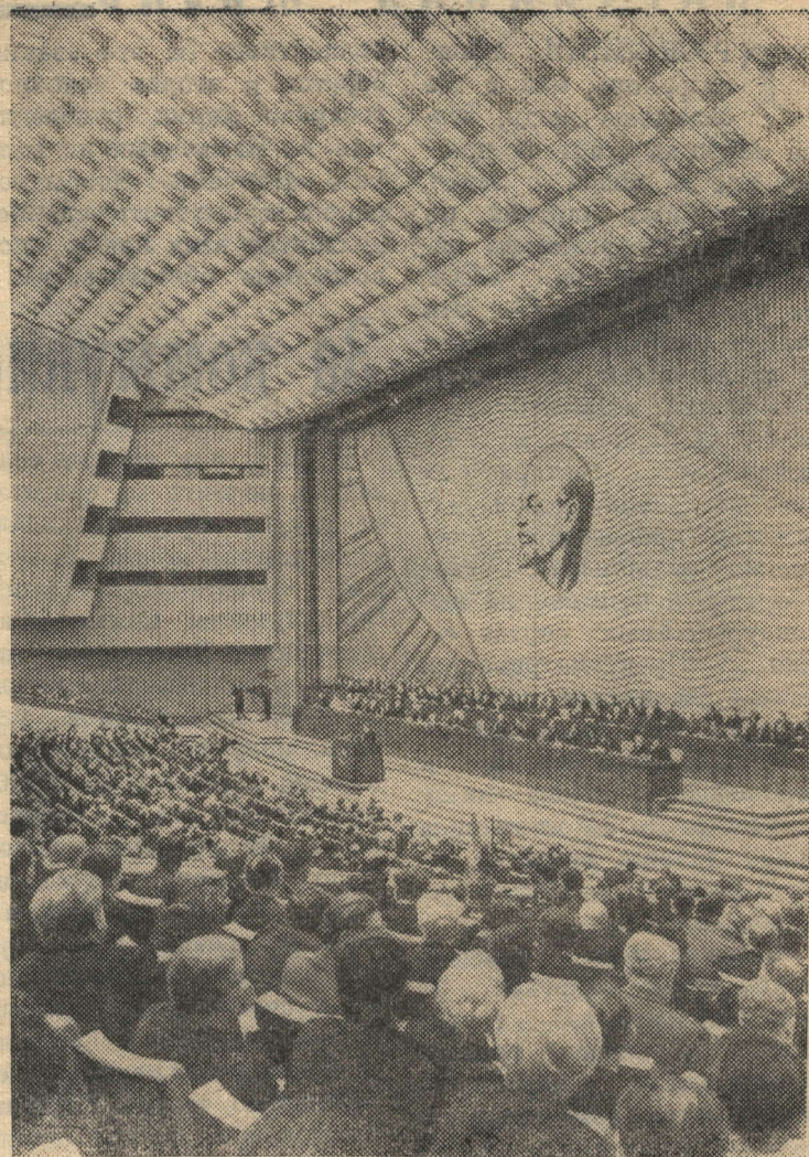
Москва. XXIV съезд КПСС. На снимке: в зале Кремлевского Дворца съездов во время заседания.