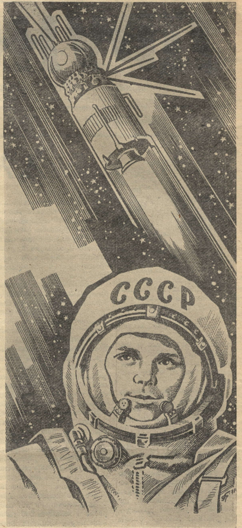
В этот день советский Советского Союза Ю. А. Гагарин первым из сынов Земли совершил полет в космическое пространство. Фотохроника ТАСС.