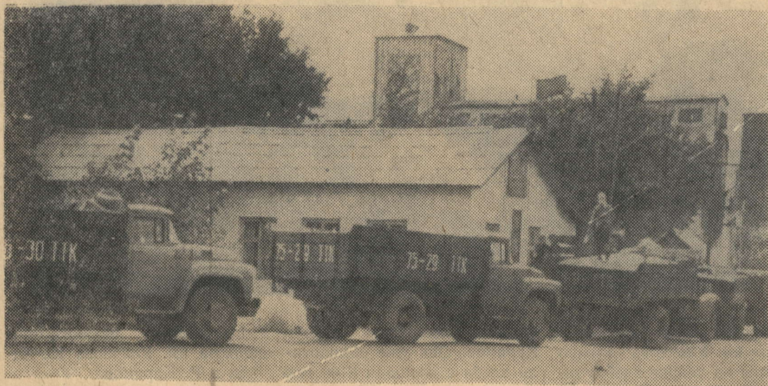
У Нурлатского элеватора.