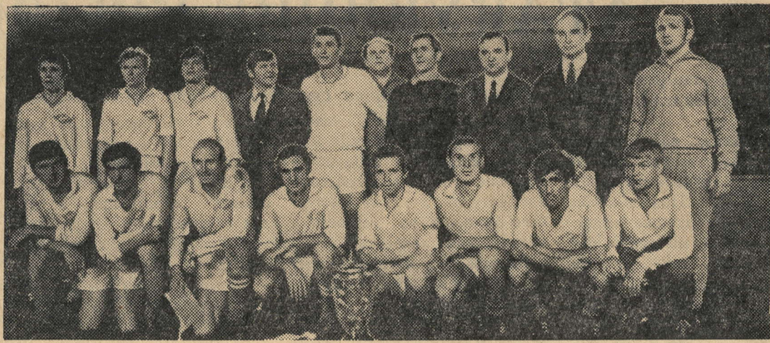
Москва. В финале XXX и СКА (Ростов-на-Дону). В равные Кубок. упорной борьбе победу одержали спортсмены „Спартака“, в девятый раз выигравшие Кубок. На снимке: команда футболистов „Спартака“.