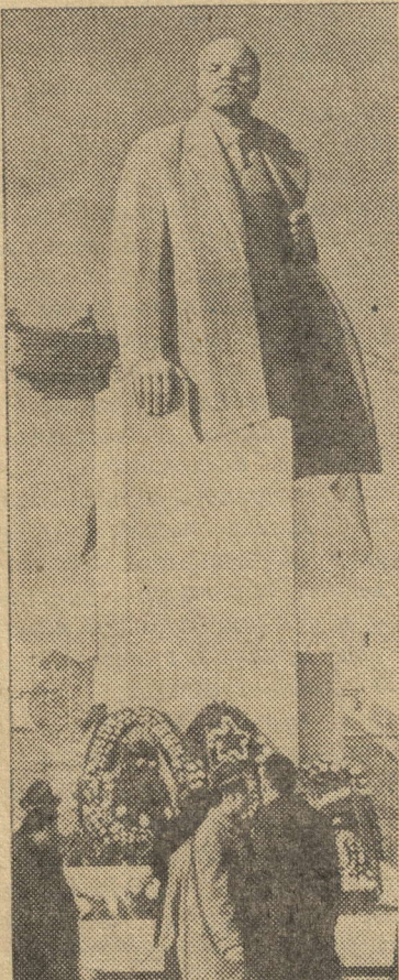
Болгария. Недавно в Софии открыт памятник В. И. Ленину.