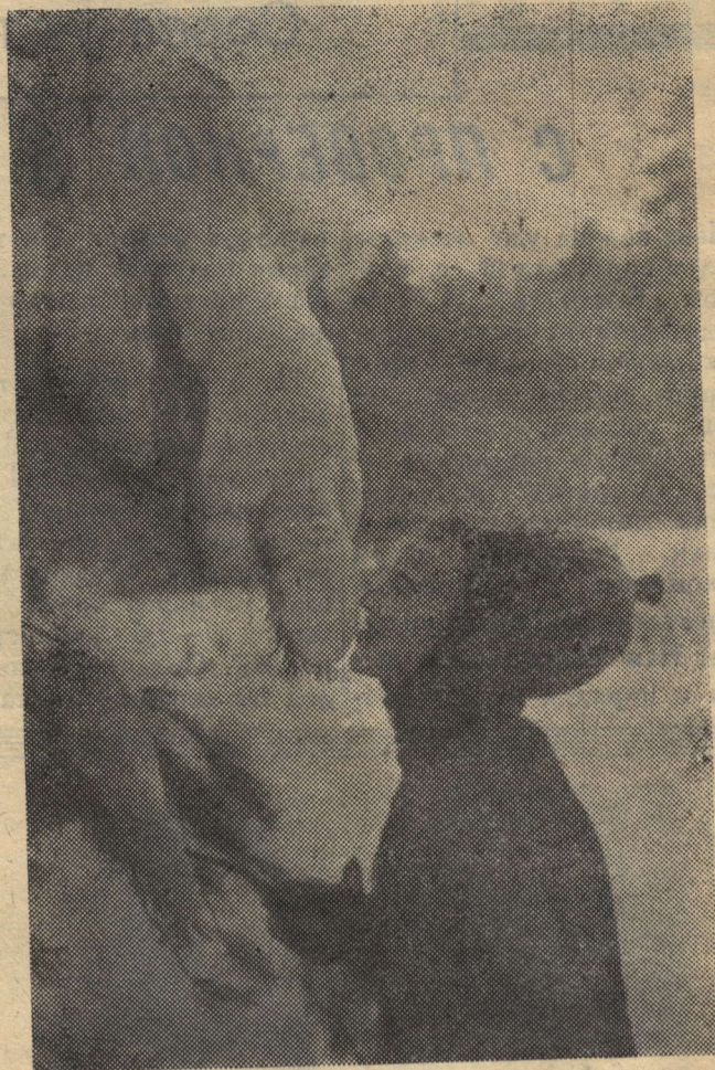
«Зимняя сказка».

Эти выставки будут показаны в клубах, учебных заведениях, на предприятиях. На снимке: работа художника П. Баранова «На строительстве Саяно-Шушенской ГЭС».