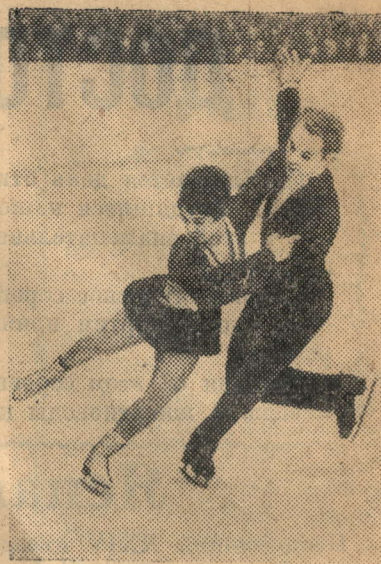
На чемпионате Европы по фигурному катанию, проходившем в Цюрихе (Швейцария), чемпионами в парном катании стали советские спортсмены Ирина Роднина и Алексей Уланов.