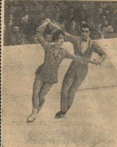
Чемпионами Европы в танцах на льду стали советские спортсмены Людмила Пахомова и Александр Горшков.